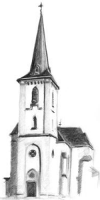
St. Margareta Eschweiler