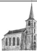
St. Stephanus Effelsberg