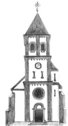
St. Petrus Rupperath