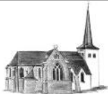
St. Goar Schönau

Am Donnerstag, dem 16.9.2010, von 15.00 Uhr - 18.00 Uhr treffen sich die Senioren im Pfarrheim in Eschweiler. Alle Seniorinnen und Senioren sind herzlich eingeladen.