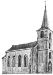
St. Stephanus Effelsberg