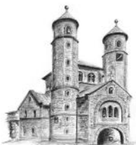
St. Chrysanthus und Daria Bad Münstereifel