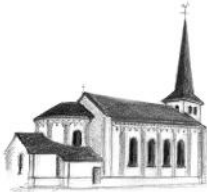
St. Laurentius, Iversheim

Aus Anlass des 150-jährigen Bestehens des MGV Arloff-Kirspenich findet am Sonntag, dem 12.9.2010, in der Konviktkapelle Bad Münstereifel ein Freundschaftssingen mit befreundeten Vereinen statt. Herzliche Einladung an alle!