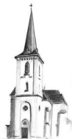
St. Margareta Eschweiler