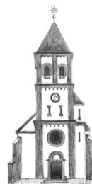
St. Petrus Rupperath