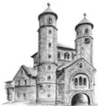
St. Chrysanthus und Daria Bad Münstereifel

Pfarrgemeinderat, Ortsausschüsse Mutscheid und Rupperath