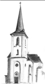
St. Margareta, Eschweiler

Am Donnerstag, dem 2.9.2010, beten wir von 18.00 Uhr bis 19.00 Uhr in der KRYPTA der Stiftskirche vor ausgesetztem ALLERHEILIGSTEN um Priester- und Ordensberufe für die Kirche. Zum Abschluss wird der sakramentale Segen gesendet.