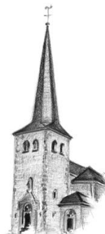
St. Bartholomäus Kirspenich