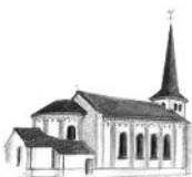
St. Laurentius, Iversheim

Pfarrgemeinderat, Ortsausschüsse Mutscheid und Rupperath