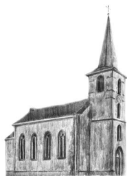
St. Stephanus Effelsberg