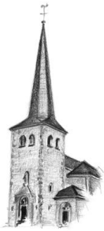
St. Bartholomäus, Kirspenich