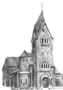
St. Thomas Houverath