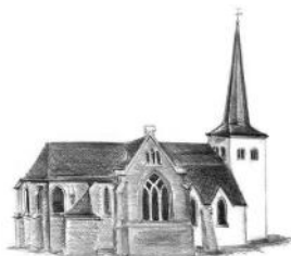
St. Goar Schönau