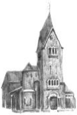
St. Thomas Houverath