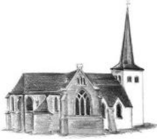
St. Goar Schönau

Am Donnerstag, dem 9.9.2010, findet ab 15.00 Uhr im Pfarrheim, Weiherstraße, der Seniorennachmittag statt. Herzlichst dazu eingeladen sind ebenso die Senioren und Seniorinnen von Kalkar.